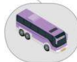
Автобус междугородного/международного следования